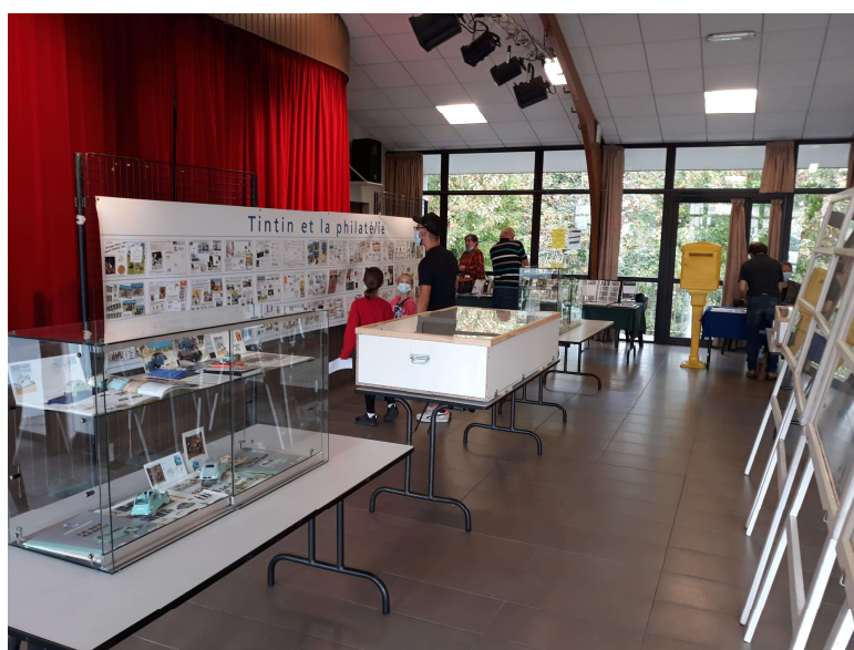
En 2021, l'APY avait déjà organisé la Fête du Timbre dans la salle des fêtes des Clouzeaux