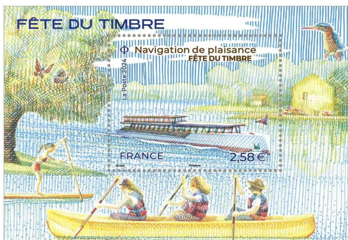
Le bloc-feuillet de la Fête du Timbre 2024