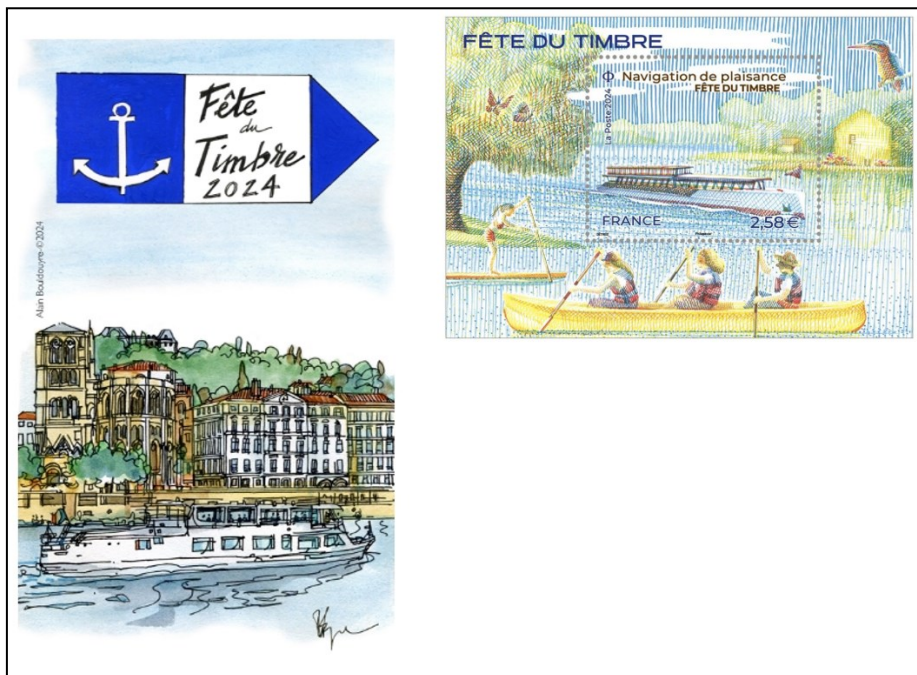
GRANDE ENVELOPPE AVEC LE BLOC (*)