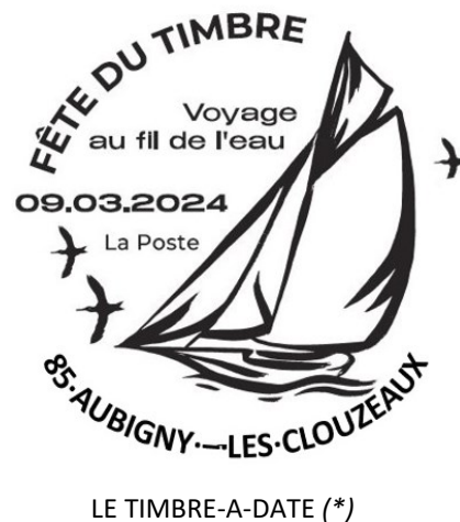
LE TIMBRE-A-DATE (*)