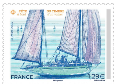
PETITE ENVELOPPE AVEC LE TIMBRE (*)