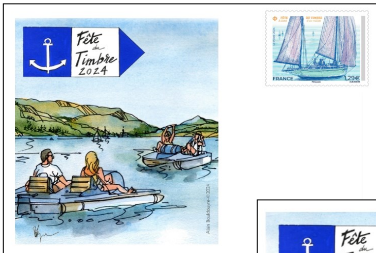
LE CACHET EXCLUSIF DE L'APY (*)

1 er transport de courrier Plan d'eau des Clouzeaux 85